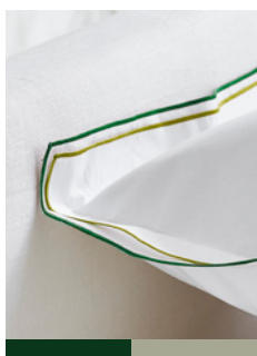
ASTOR FOREST & SAGE