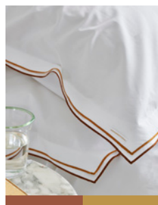
ASTOR CHESNUT & OCHRE