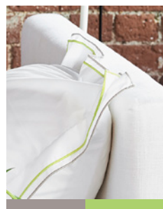
ASTOR GREY & LIME

APPORTEZ UNE TOUCHE DÉCO SUPPLÉMENTAIRE AVEC LES ACCESSOIRES ADD AN EXTRA DECORATIVE TOUCH WITH ACCESSORIES